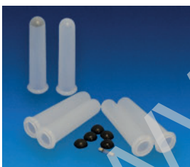
[01] Kit accesorios REF- GBK001 6 portatubos 6 conteras 1 fusible