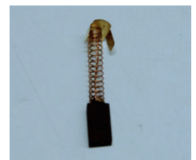
[04] Escobilla REF- GBK004