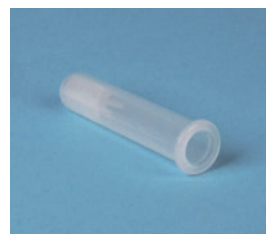
[03] Adaptador tubos 7/5 mL REF- GBK003 Dimensiones: 13x75 mm