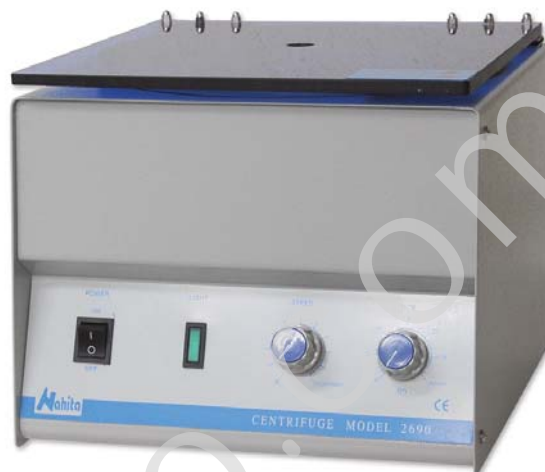
REF. GBC002; GBC003