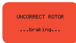
Señal de alarma