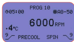
Programa de protección