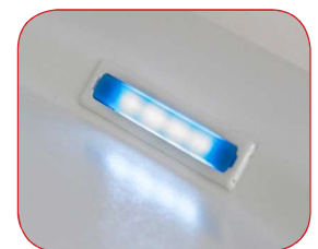
Señal luminosa de ciclo, y fin de programa